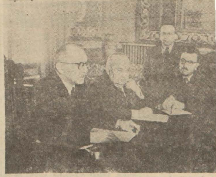
Başvekil evvelki gün gazetecilerle görüşürken

Şeker toptan fiyatı: Kırstal 480, küp kilosu 500 ku